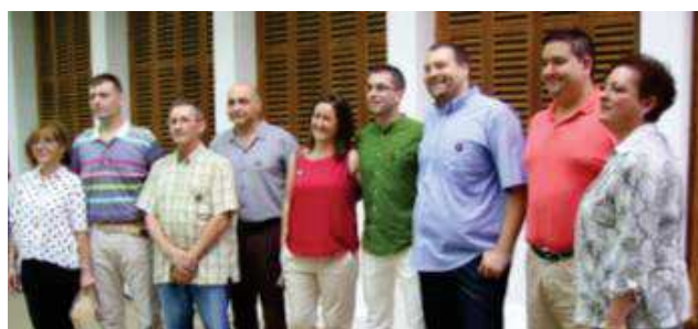
Els membres de la nova corporació municipal el passat 13 de juny de 2015